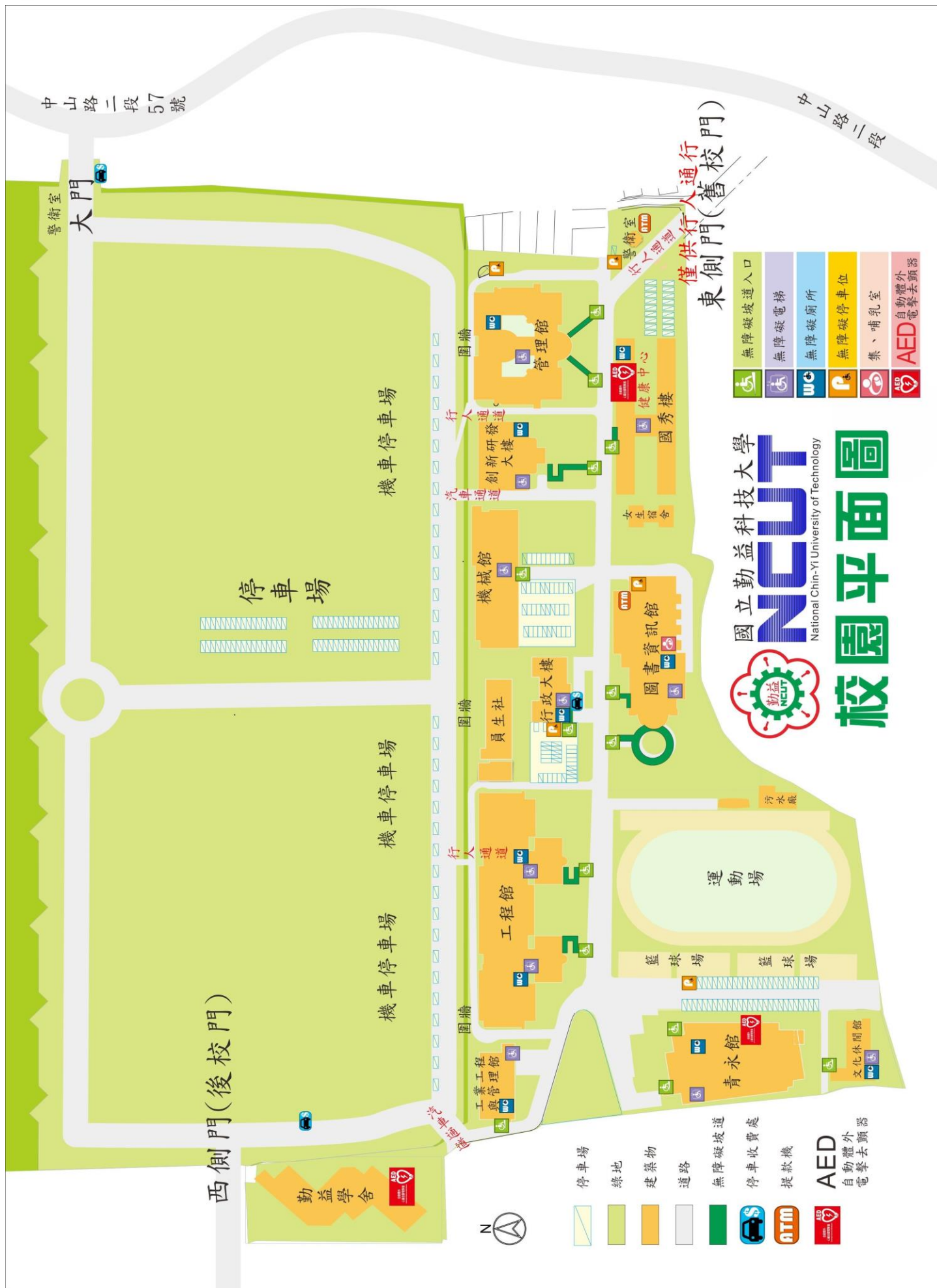
【附表十二】校園平面圖