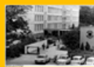
【維爾施塔特應用科學大學】