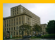
【德累斯頓工程和經濟應用科技大學】