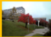
【埃斯林根應用科技大學】