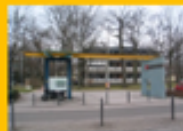
【卡爾斯魯厄應用科技大學】