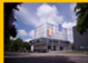
【亞琛應用技術大學】