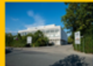
【柏林技術與經濟應用科技大學】